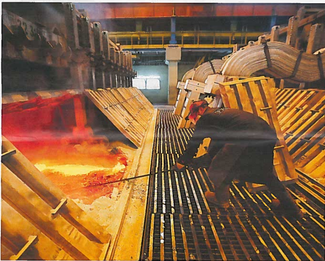
LA PHOTO DE LA SEMAINE