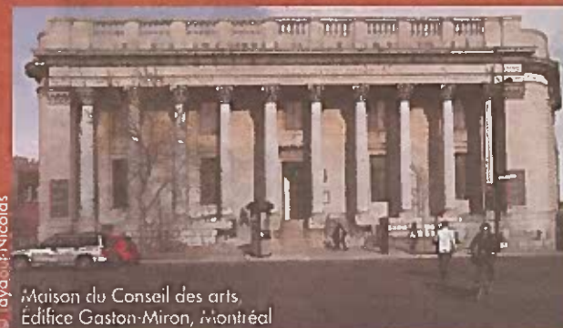
Maison du Conseil des arts, Édifice Gaston-Miron, Montréal

Le Conseil des arts de Montréal : pour découvrir de nouvelles façons de participer au développement du cœur créatif de Montréal. artsmontreal.org